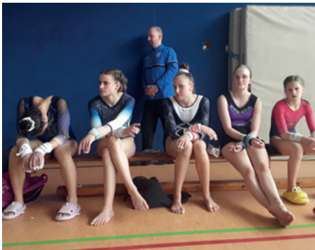
Warten auf den Einsatz. Unbeobachtet und wenn Fotos gemacht werden